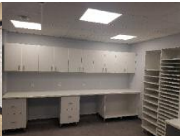
Meubles pour le Plateau technique