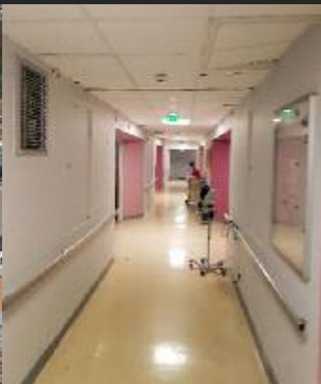
Peinture, remplacement du faux plafond et de l'éclairage à l'unité cognitivo-comportementale (UCC).