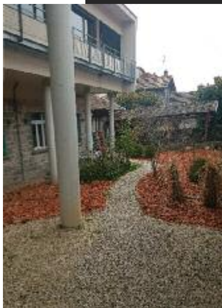
Cours extérieure réa/lab, réalisée grâce à la réutilisation d'anciennes tuiles de toit.