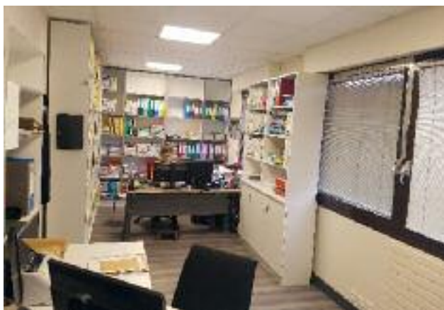
Destruction d'une cloison afin d'agrandir l'espace de travail du secrétariat des services techniques.